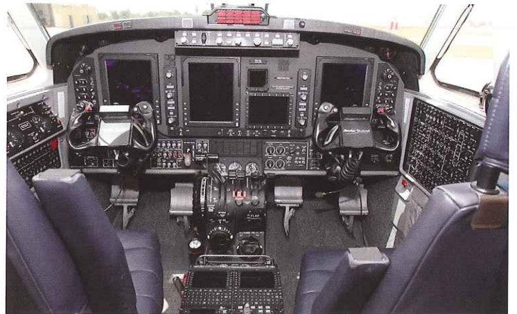
Het 'kantoor': FMS en Mission System Display.