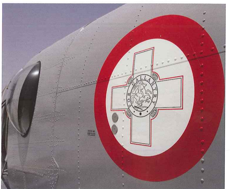
'For gallantry': collectieve inzet bevolking tijdens het beleg in 1942.