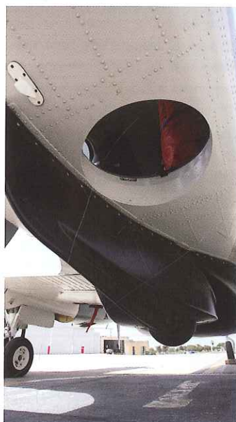
Detail van de drophatch.