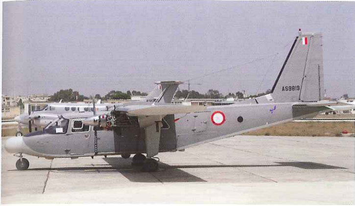
De verouderde BN-2 en de nieuweling.